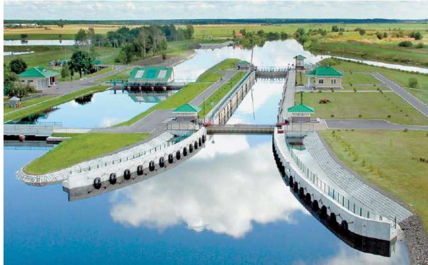
Малая ГЭС «Дубой» на Днепро-Бугском канале

В ближайшее время в Беларуси должны быть созданы все условия для того, чтобы энергетические установки, работающие на альтернативных и возобновляемых источниках энергии, стали гармоничной составляющей единой энергосистемы республики.