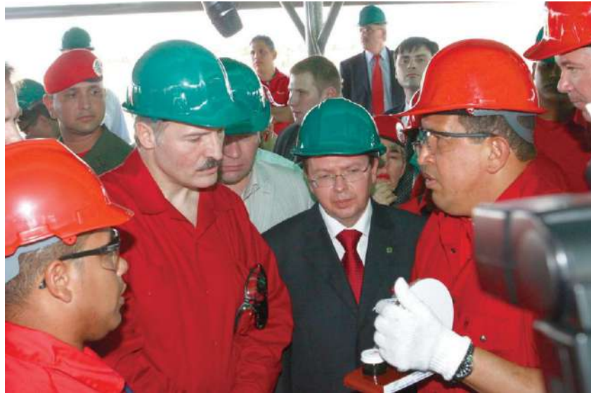
Президенты Александр Лукашенко и Уго Чавес на совместном предприятии по добыче нефти в Венесуэле (08.12.2008)

которые планируют строить единую станцию на три государства.