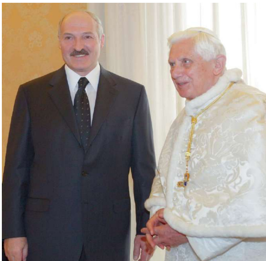
Президент А. Лукашенко с Папой Римским Бенедиктом XVI в Ватикане 27 апреля 2009 г.

Государство и церковь должны активнее взаимодействовать в вопросах укрепления семейных ценностей, сохранения и приумножения духовного и исторического наследия белорусского народа.