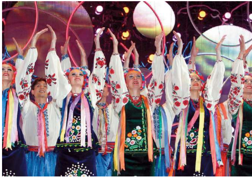
Национальный заслуженный академический ансамбль танца Украины им. П. Вирского на «Славянском базаре» в Витебске 10 июля 2009 г.

В настоящее время в соответствии с отраслевой программой развития культуры до 2012 года подготовлено досье на архитектурные памятники Полоцка, которое направлено в Центр всемирного наследия ЮНЕСКО. В почетный список включены Спасо-Преображенская церковь полоцкого Спасо-Евфросиниевского монастыря, Софийский собор, а также исторические территории, которые связаны с именем православной святой Евфросинии Полоцкой. Собрано досье на Августовский канал. Запланированы к номинации «Деревянное зодчество Полесья» и «Культовое зодчество Беларуси оборонного типа», основные объекты которых расположены в Витебской, Гомельской и Гродненской областях.