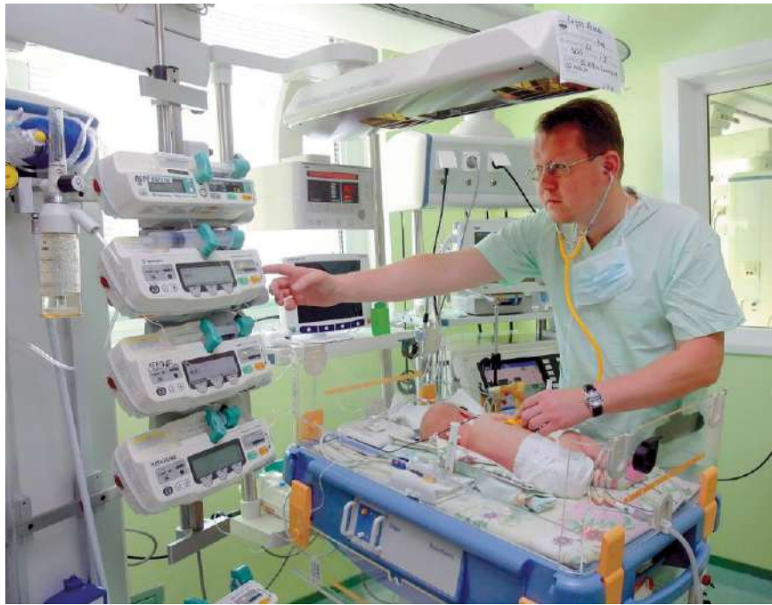
Детский кардиохирургический центр

Задачам государственной политики охраны здоровья населения отвечала принятая в 2007 году Национальная программа демографической безопасности Республики Беларусь на 2007–2010 гг., Комплексная программа борьбы против табака в Республике Беларусь на 2008–2010 гг., охватывающая все аспекты антитабачной деятельности.