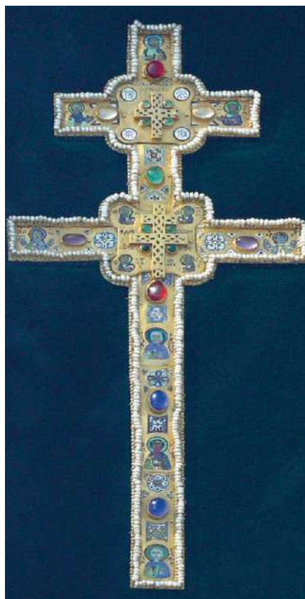
Крест Евфросиньи Полоцкой

Основные усилия социальной деятельности таких влиятельных протестантских направлений, как христиане веры евангельской, евангельские христиане-баптисты и некоторых иных, направлены на вопросы воспитания молодежи, формирование того поколения верующих, которое придет завтра. Много усилий прилагается в рамках работы среди заключенных и малообеспеченных семей. Реабилитационные программы распространены среди лиц, имеющих пагубные наклонности. Важную роль играют образовательные программы, особенно среди молодежи. Акцент, очевидно, делается на духовное образование и воспитание. Таким образом, как отметил Президент А.Г. Лукашенко в Послании белорусскому народу и Национальному собранию Республики Беларусь 23 апреля 2009 г., «Беларусь стала общим домом для представителей разных наций и вероисповеданий. В нашей стране созданы необходимые условия для деятельности всех зарегистрированных религиозных организаций, воплощается в жизнь уникальная модель партнерских отношений между государством, Правительством, Православной и Католической церковью – основными нашими конфессиями».