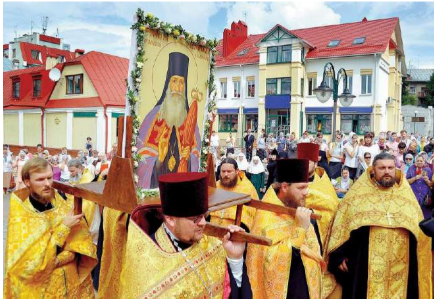
Крестный ход в память Георгия Конисского в Могилеве

славная церковь. Соглашение о сотрудничестве между государством и Православной церковью, заключенное 12 июня 2003 г., стало логическим следствием выверенной государственной политики, отражающей интересы как рядовых граждан, так и церкви. Приоритетными направлениями сотрудничества являются общественная нравственность, воспитание и образование, культура и творческая деятельность, охрана, восстановление и развитие исторического и культурного наследия, здравоохранение, социальное обеспечение, милосердие, благотворительность, поддержка института семьи, материнства и детства, попечение о лицах, находящихся в местах лишения свободы, воспитательная, социальная и психологическая работа с военнослужащими, охрана окружающей среды. Православная церковь обязуется уважительно относиться к государству как «социальному институту, призванному обеспечивать общественный порядок, защищать национальные интересы, охранять духовные и культурные ценности народа», совместно с государством противодействовать «псевдорелигиозным структурам, представляющим опасность для личности и государства».