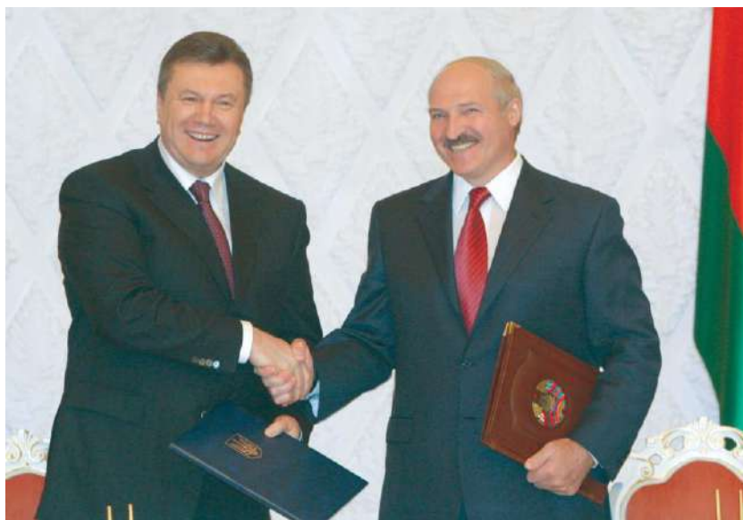
Президенты А. Лукашенко и В. Янукович (29.04.2010)

ной политики». Основанием такого рода внешней политики служит убежденность в том, что на международной арене в принципе не может быть «одного хозяина». Модель однополярного мира, особенно после экономического кризиса 2008-2009 гг., дискредитирована, и атлантическое мышление вряд ли имеет шансы на историческое выживание. В ООН, Движении неприсоединения, на многих мировых форумах последних лет высказывается мысль, что нужны новые принципы организации международной безопасности, поскольку те, что были заявлены и реализованы после развала СССР, не могут претендовать на понимание во многих столицах мира. Многополярность, учет интересов всех субъектов международного права – вот основа многовекторной политики. Причем учитывается тот фактор, что многополярность – не самоцель. Все мы хорошо помним биполярное устройство мира, которое рухнуло в одночасье, создав угрозу миру. В этом смысле основой мирового устройства должна стать такая модель, которая будет основана не на конфронтации, а на взаимодействии. Только такая система будет долговечной и стабильной.