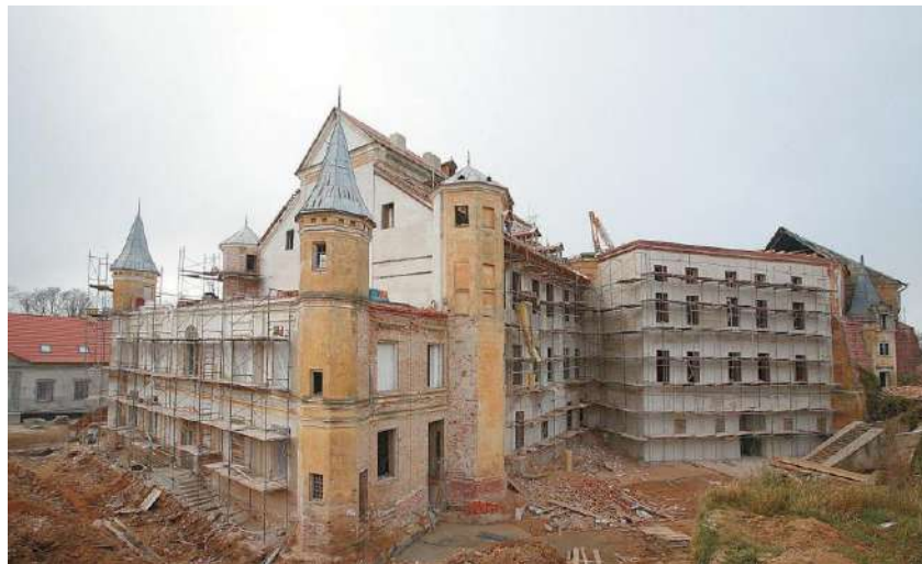
Реконструкция Несвижского замка

Полагаем, нам в первую очередь следует искать критерии оценки интеллекта человека как подлинного субъекта человеческой истории третьего тысячелетия. Ведь и в XXI веке товары, в конечном счете, будут создаваться не машинами и не самими знаниями, а человеком , обладающим этими знаниями, вернее – интеллектом. Вот почему уже в нашу историческую эпоху борьба за источники сырья и рынки сбыта товаров все активнее дополняется столь же активной, целенаправленной, бескомпромиссной борьбой за людские умы и таланты, за повышение интеллекта нации в целом . Решение все более актуальной для Европы демографической проблемы, сводится не только и, может быть, не столько к росту народонаселения. В таком случае не составило бы труда ее разрешить за счет иммигрантов. Но речь ведь идет об интеллектуальном потенциале нации, о максимальном его наращивании как приоритетной задаче в ус-