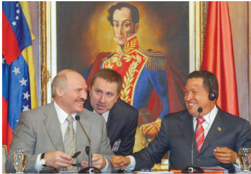
Президенты Александр Лукашенко и Уго Чавес в Каракасе (18.03.2010)