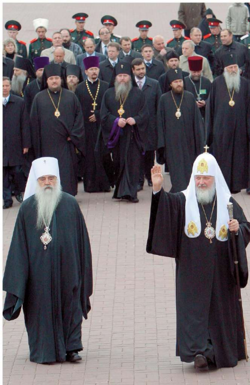
Патриарх Кирилл в Витебске

И пятое. По ряду направлений социальной деятельности государство и церковь проявляют единство практических действий. Это касается, в частности, совместного участия в деятельности различных миротворческих организаций (Фонд мира и др.), осуществлении социальных программ, культурной деятельности. Заявленный принцип светскости государства позволяет конкретизировать те или иные нормы взаимодействия. Здесь следует особо подчеркнуть ту взвешенную позицию, которая была занята по поводу предложений различных лиц и организаций ввести в школах, в целом в учебных заведениях преподавание основ православия, иных мировых религий. В данный момент принятие положительного решения было признано нецелесообразным.