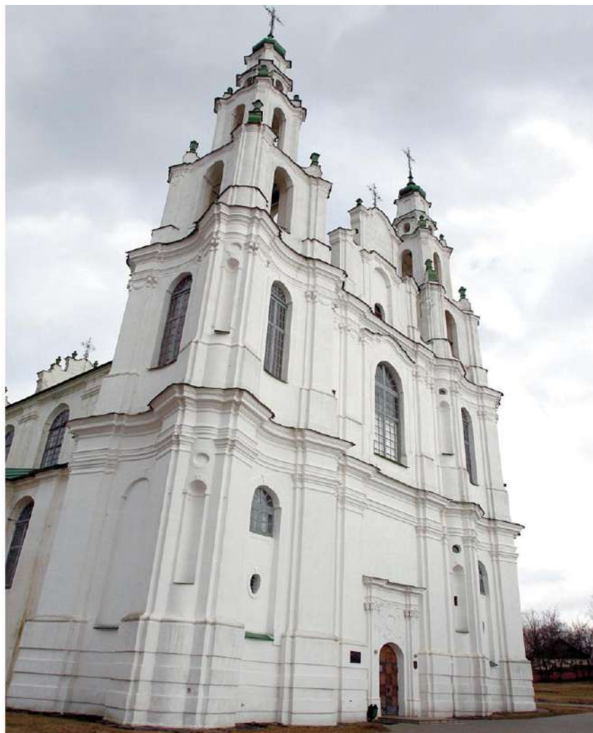
Софийский собор в Полоцке

Дополнительные возможности для работы по эстетическому воспитанию населения, пропаганде творческих достижений белорусских мастеров изобразительного искусства получил Национальный художественный музей Республики Беларусь с введением в эксплуатацию нового корпуса, который оснащен оборудованием и технологиями, отвечающими современным требованиям.