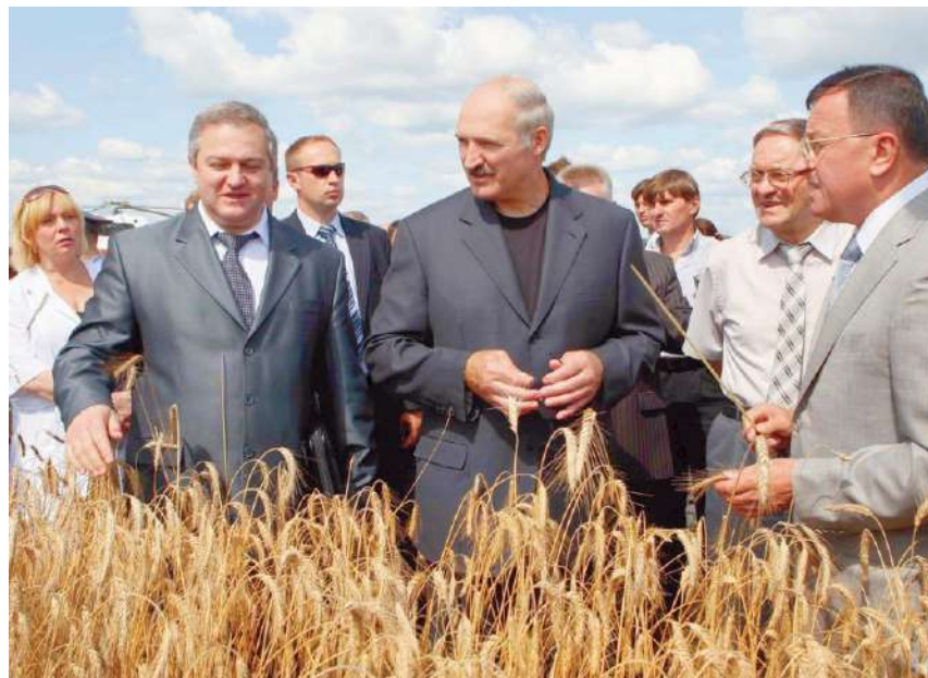
Президент Александр Лукашенко во время посещения белорусско-датского ИООО «Белдан» в Ляховичском районе Брестской области (07.08.2009)

Это позволило значительно увеличить экспорт продовольствия, прежде всего в Россию. В 2008 году он увеличился на 36% по сравнению с 2007 годом и достиг 1,4 миллиарда долларов. Рост экспорта продовольствия увеличивался и в 2009–2010 гг. В 2010 году экспорт сельскохозяйственной продукции составил 3,5 миллиарда долларов.