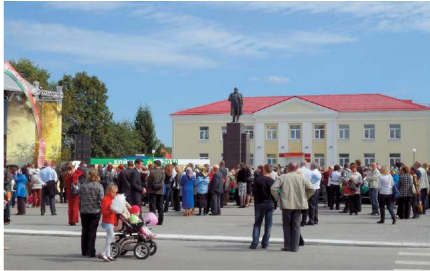
День белорусской письменности в Хойниках (05.09.2010)

ловиях перехода стран к постиндустриальному типу общественного развития.