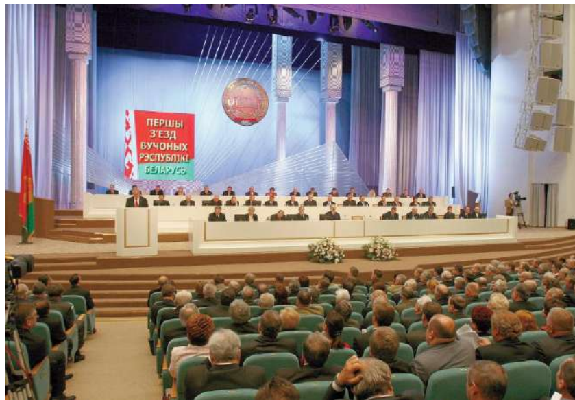
Первый съезд ученых Беларуси 2 ноября 2007 г.

последних полутора десятилетий стабильный экономический рост, в целом сложились все необходимые условия и предпосылки. Так, по подсчетам специалистов, доля нашей страны в мировом ВВП стабильно растет с 0,1% в 1995 г. до 1,36% в 2007 г., а белорусский экспорт товаров и услуг в период с 1993 по 2007 гг. увеличился в 13 раз – с 2 до 26 млрд USD 105 . Беларусь не просто самой первой из стран бывшего СССР вышла на дореформенный (1990 г.) уровень развития по абсолютному большинству социально-экономических показателей и сегодня существенно превзошла его, но и демонстрирует уверенный экономический рост, характерный для большинства современных индустриально развитых стран. И действительно, в то время как другие страны бывшего СССР до сих пор не вышли на дореформенный объем промышленного производства, в Республике Беларусь он превышен в 2 раза. При этом в обрабатывающих отраслях промышленности, развитие которых определяет место страны в иерархии технологически развитых держав, этот прирост еще больше – 2,5 раза. Указанный факт свидетельствует не просто о механическом наращивании ВВП за счет, например, активной распродажи содержимого земных недр, как это имеет место у некоторых наших соседей, а именно об индустриальном характере развития белорусской национальной экономики.