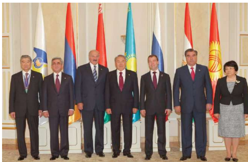
Межгосударственный Совет ЕврАзЭС принял решение о запуске Таможенного союза (Астана, 05.07.2010)

Следует обратить особое внимание на то, что указанное строительство ЕврАзЭС и его «ядра» – Союзного государства представляет собой именно интеграционный процесс, объединяющий взаимодополняющие друг друга страны. Достаточно отметить, что совокупный торговый оборот стран ЕврАзЭС с 2005 по 2008 годы возрос более чем в 2,2 раза. При этом товарооборот Беларуси со странами Сообщества в 2008 г. превысил более 37,1 млрд долл. США, что составляет 51,2% общего торгового оборота страны, равного 72,4 млрд долл. США (со странами СНГ – 55,9% общего торгового оборота страны) (табл. 2). Это означает, что на сегодня ЕврАзЭС для Беларуси является одним из самых главных внешнеторговых партнеров.