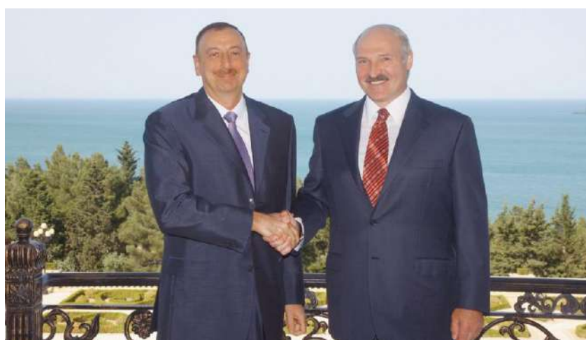
Президент Беларуси Александр Лукашенко и Президент Азербайджана Ильхам Алиев (Баку, 03.06.2010)

Республика Беларусь, находящаяся в центре Европы, на территории которой не раз «сходились» в жестком противоборстве интересы не только различных военных, экономических, конфессиональных союзов, но и цивилизаций, уже только по этим основаниям призвана учитывать и реализовать как исторический контекст, так и современные реалии. Многовекторная политика есть проявление внешнеполитического выживания и развития, кроме этого, речь идет и о строительстве единой системы безопасности, и о понимании важности выступать единым фронтом перед лицом угроз, представляющих опасность для всех стран мира.