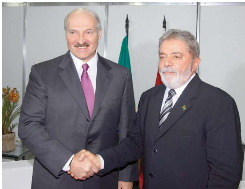
Президент Беларуси Александр Лукашенко и Президент Бразилии Луис Игнасиу Лула да Силва (22.03.2010)

Республика Беларусь, находящаяся в центре Европы, на территории которой не раз «сходились» в жестком противоборстве интересы не только различных военных, экономических, конфессиональных союзов, но и цивилизаций, уже только по этим основаниям призвана учитывать и реализовать как исторический контекст, так и современные реалии. Многовекторная политика есть проявление внешнеполитического выживания и развития, кроме этого, речь идет и о строительстве единой системы безопасности, и о понимании важности выступать единым фронтом перед лицом угроз, представляющих опасность для всех стран мира.