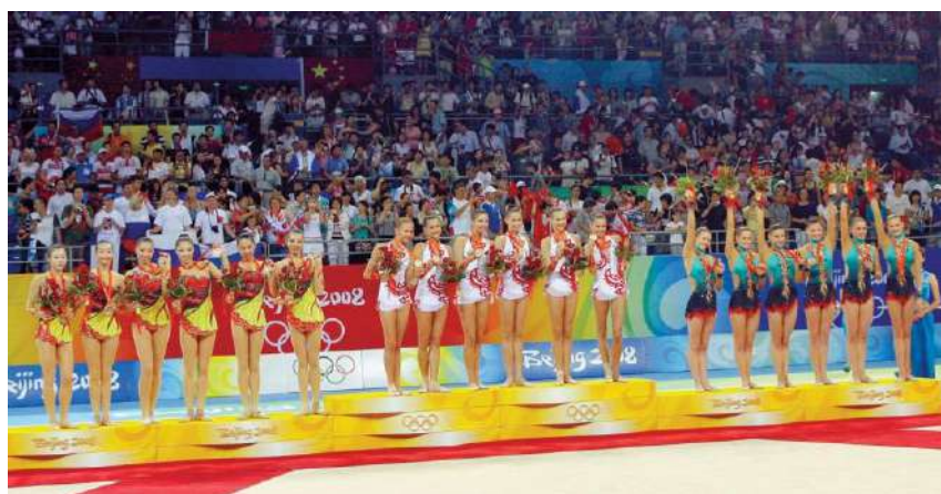
Белорусские гимнастки бронзовые призеры Олимпиады в Пекине

Новый облик приобрели две главные олимпийские базы страны – «Стайки» и «Раубичи». В Минске построен велодром – уникальнейшее сооружение мирового уровня. В декабре 2009 г. сдан в эксплуатацию грандиозный олимпийский объект «Минск–Арена», который может принимать соревнования по 28 видам спорта, открыт новый Ледовый дворец в Барановичах.