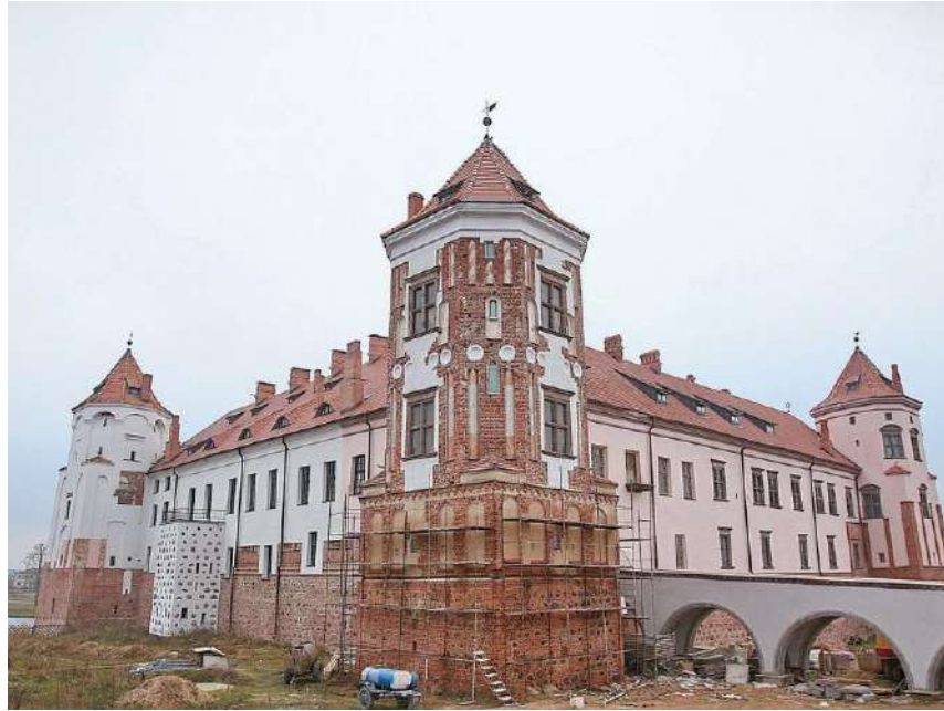
Реконструкция замкового комплекса в поселке Мир