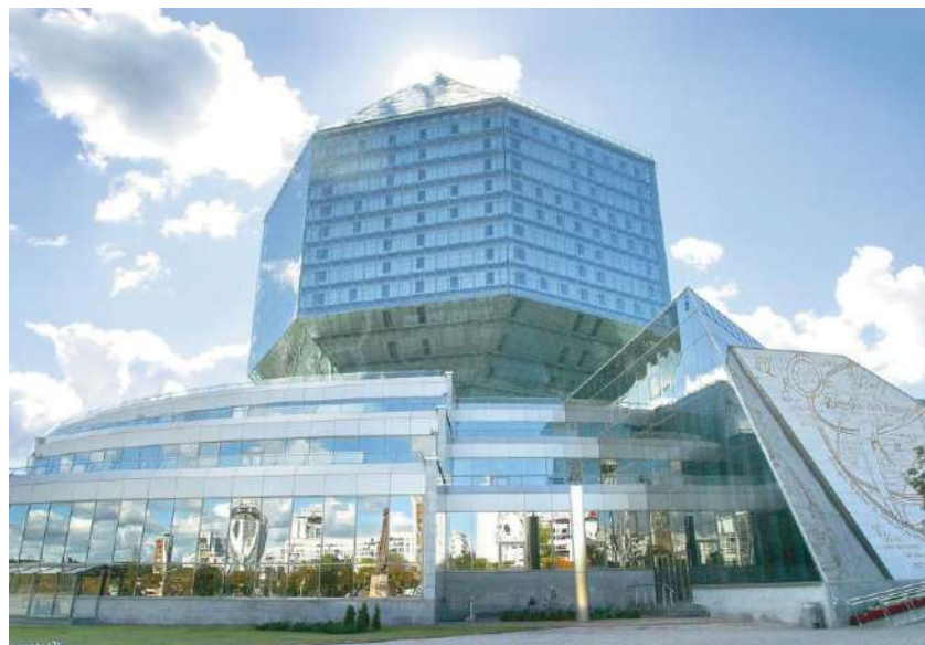
Здание Национальной библиотеки

поступлении в вуз, неотработанность концепции профильного обучения. Реализация школьной реформы привела к значительному увеличению школьной нагрузки, однако не обеспечила адекватное повышение качества образования. Как показали социологические опросы, большая часть родителей, учителей и учеников не поддержала введение 12-летки, посчитав более оптимальным 11-летний срок обучения в школе. Это потребовало усовершенствования организации общего среднего образования.