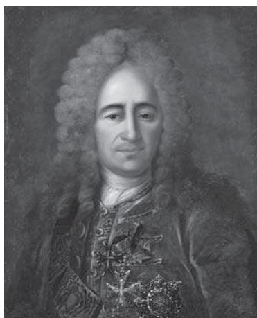
Картина. Портрет графа Гавриила Ивановича Головкина. Неизвестный художник с портрета 1720-х г. работы Ивана Никитича Никитина. Середина XIX в.