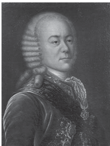
Картина. Портрет генерал-аншефа Василия Яковлевича Левашева. Неизвестный художник. Середина XIX в.