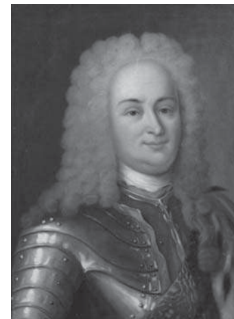
Картина. Портрет князя Аникиты Ивановича Репнина. Неизвестный художник с портрета 1724 г. Середина XIX в.