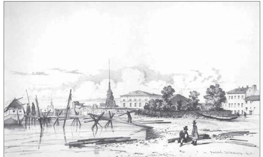
Литография. Домик Петра I со стороны набережной Невы на Петербургской стороне. А. Дюран. 1842 г.

Возвышается город-виденье. А в домишке внутри, Пуган бунтом и вымотан риском, Петр не спит до зари. Черен кров, нависающий низко.