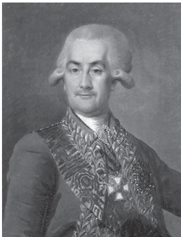
Картина. Портрет генерала Иосифа Андреевича Игельстрома. Неизвестный художник; варьированная копия с портрета Дмитрия Григоровича Левицкого 1790-х гг. Середина XIX в.