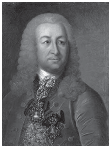
Картина. Портрет Иоганна Германа Лестока. Неизвестный художник; варьированная копия с портрета 1740-х гг. работы Георга Кристофа Гроота. Середина XIX в.