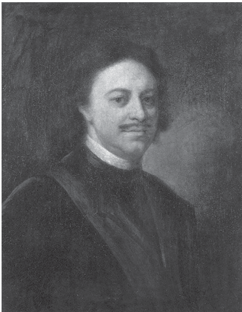
Картина. Портрет императора Петра I. Неизвестный художник; иконографический тип К. Моора. XVIII в.