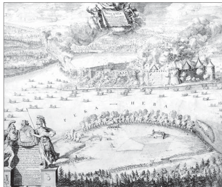
Гравюра. Взятие Нотебурга 11 октября 1702 года. А. Шхонебек. 1703 г.

Осенью 1702 году русские взяли крепость Нотебург (бывший русский Орешек), а весной 1703 года и Ниеншанц, контролировавший устье Невы. Крепость Ниеншанц была срыта, а неподалеку началось строительство знаменитой Петропавловской крепости и нового города — Санкт-Петербурга, которому было суждено стать столицей Российской империи. Для защиты нового города с моря в Финском заливе на острове Котлин была построена крепость Кронштадт. Россия продолжала утверждаться на Балтике, заняв Ям, Копорье, Мариенбург и другие города. В 1704 году были взяты Дерпт (древний русский город Юрьев), Нарва и Иван-город.