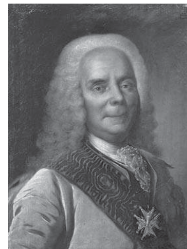
Картина. Портрет князя Василия Владимировича Долгорукова. Неизвестный художник с оригинала конца 1720–1730-х гг. Середина XIX в.