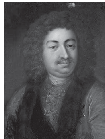
Картина. Портрет графа Федора Алексеича Головина. Иван Шпринг; с неизвестного оригинала. Середина XIX в.