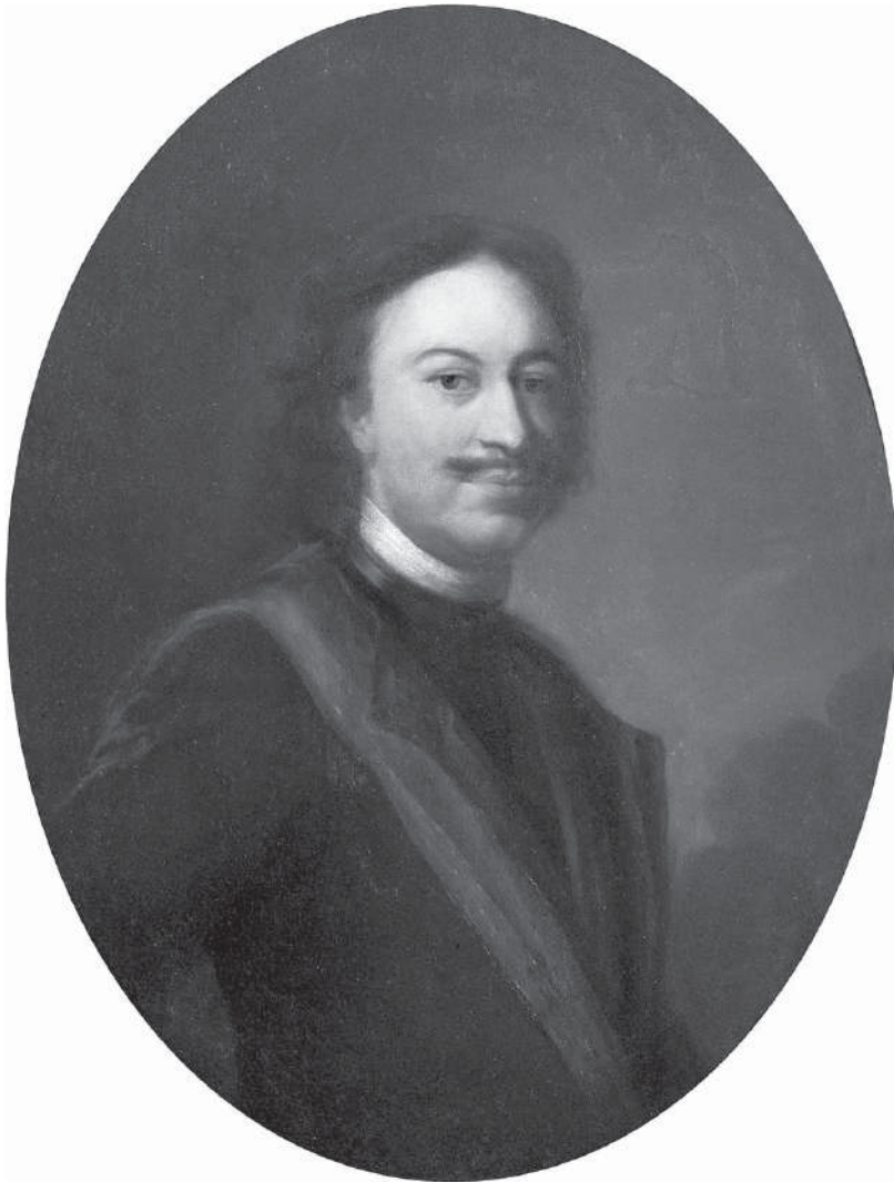
Картина. Портрет императора Петра I. Неизвестный художник круга Дмитрия Григорьевича Левицкого; иконографический тип К. Моора. 1717 г.

Нельзя с полной уверенностью утверждать, что Петр I направил ход истории нашей страны совсем в иное русло. Его предшественники были не менее талантливы, но проводили реформы в более умеренных темпах. Петр I же отличался своей радикальностью, некоторые реформы были совершенно уникальны и в этом, безусловно, заслуга Петра. Реформы Петра были подготовлены всей предшествующей историей народа, «требовались народом». Уже до Петра начертана была довольно цельная преобразовательная программа.