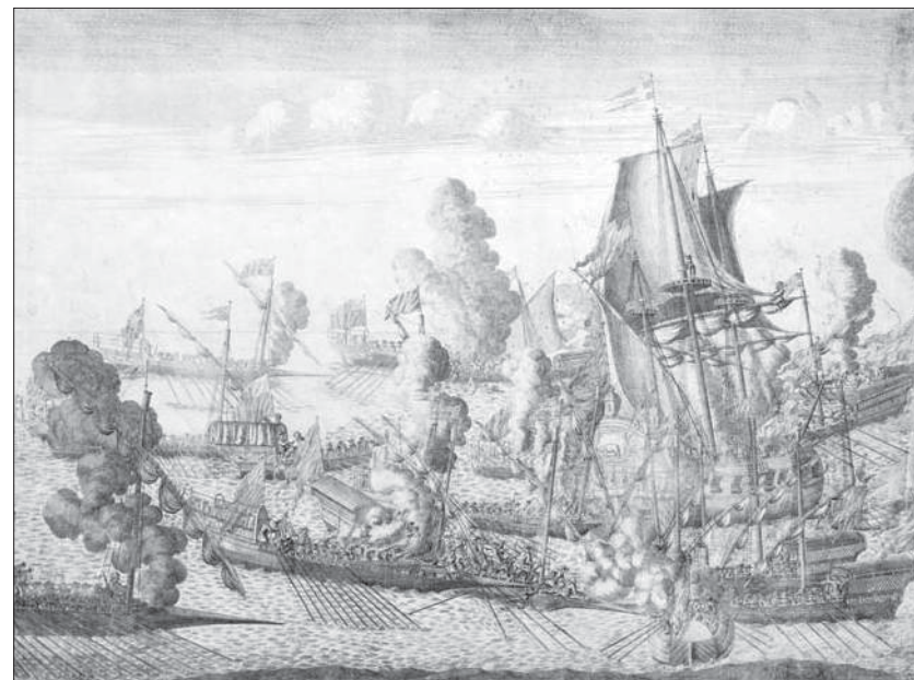
Гравюра. Сражение при Гангуте в июле 1714 года. А. Ф. Зубов. 1715 г.