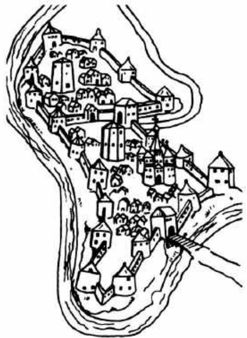
| План Полоцка. 16 век.

Троки было не удержать, и Витовт ушёл с матерью в Гродно. Туда же спешно прибыл Кейстут, который, несмотря на преклонный возраст, был энергичен и имел свой план борьбы с Ягайло. 3 августа 1382 года под Троками друг против друга стояли две мощные армии. С одной стороны позиции заняли полки Кейстута, Витовта и Любарта, а с другой — Ягайло, Скиргайло и прибывших им на помощь крестоносцев.