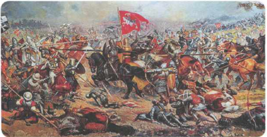
| Битва на Ворскле. 1399 г.

Сражение разгоралось с чудовищной силой. Раздавался лязг мечей и боевых топоров, звуки пищальных и пушечных выстрелов, свист стрел. Литовско-русская кованая рать стала теснить