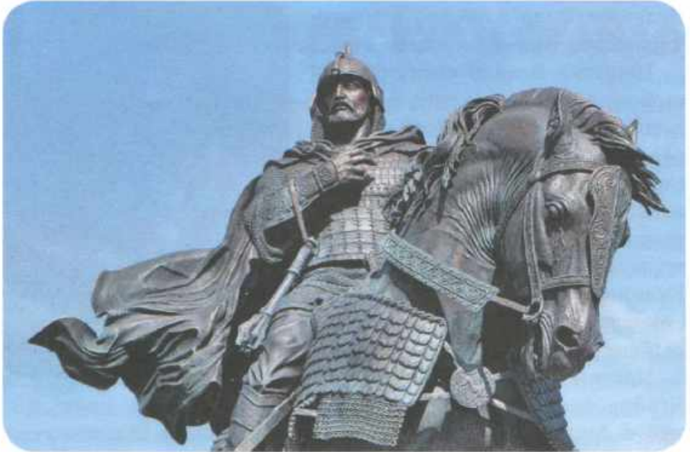
Памятник Дмитрию Донскому в Коломне.

Ягайло был вынужден подписать фактическое отречение от престола, признав великим князем литовским Кейстута. К Полоцку уже шёл с сильным войском Андрей Полоцкий. Осаждавший город Скиргайло, узнав о пленении Ягайло, поспешил признать верховную власть Кейстута, тут же снял осаду и покинул Полоцк, бежав в Ливонию.