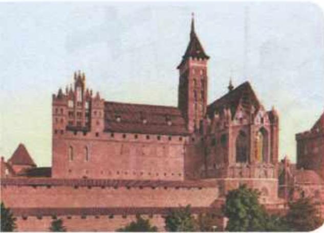
Резиденция Тевтонского ордена в Мариенбурге (ныне г. Мальборк, Польша).

Опираясь на поддержку православной знати и своё право на престол по старшинству, Андрей Полоцкий не подчинился завещанию отца и вступил в борьбу со своим братом Ягайло.