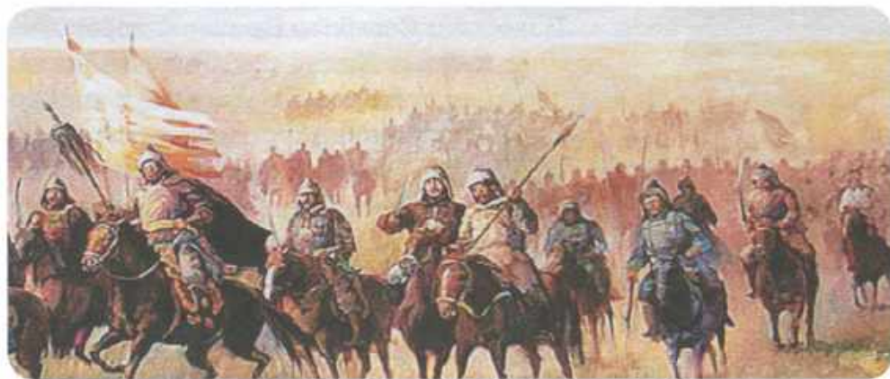
Татары идут на Русь.

В итоге после ожесточённой схватки, продолжавшейся несколько часов, ордынцы не только не смогли одержать верх, но и попали в окружение. Часть татар была перебита, пали и все три нойона. Полностью деморализованные ордынцы в панике начали отступать, не выдержав натиска Ольгерда, Андрея и их союзников.