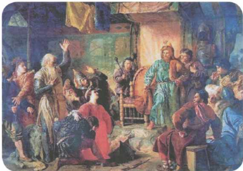
| Кейстут и Витовт в плену у Ягайло. С картины В. Герсона.

Вспомнили и о томившемся в темнице Андрее Полоцком. На имя Ягайло поступило поручительство с просьбой выпустить Андрея Полоцкого на волю, подписанное Витовтом и ещё