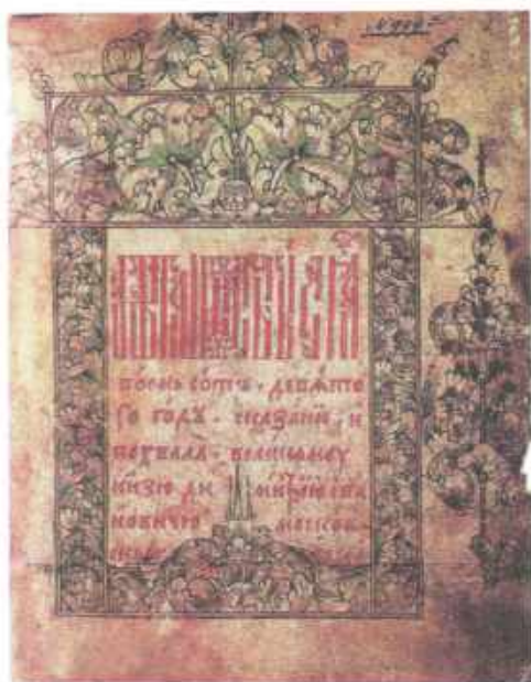
Сказание о Мамаевом побоище. 17 в.

Ягайло успел договориться с давними противниками Кейстута — крестоносцами, и закованные в латы тевтонцы