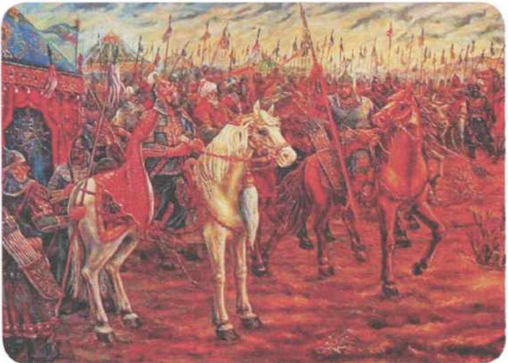
| Поход Тамерлана на Русь в 1395 г.

Витовту удалось собрать под свои знамена войско, в которое входили литовско-русские дружины, полки польской шляхты, сильные отряды закованных в броню крестоносцев и ордынские татары — всего около 100 тысяч человек. Это огромное по средневековым меркам войско двинулось походом на Золотую Орду.