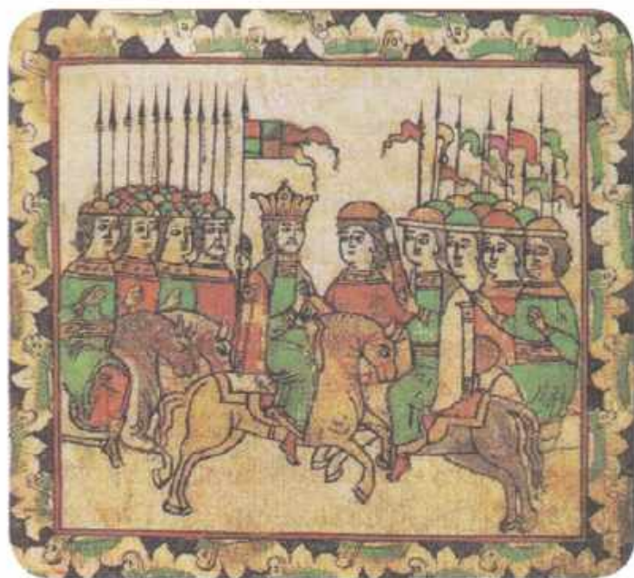
Великий князь московский Дмитрий встречает дружину князей Андрея и Дмитрия Ольгердовичей. Миниатюра 17 в.

Сразу после этого друг на друга бросились татарский авангард и сторожевой полк. Так началась знаменитая Куликовская битва. Дмитрий Донской бился в рядах сторожевого полка, а затем с его остатками отошёл к большому полку.