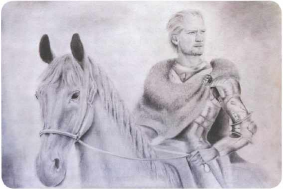
| Ольгерд. Рисунок С. Шейбака.

походе Андрей Полоцкий был рядом с отцом. Навстречу войску Ольгерда и Андрея выступили нойоны хана Мурада, ставшего ханом Золотой Орды. Нойоны были монголо-татарскими князьями и ближайшими помощниками ханов.