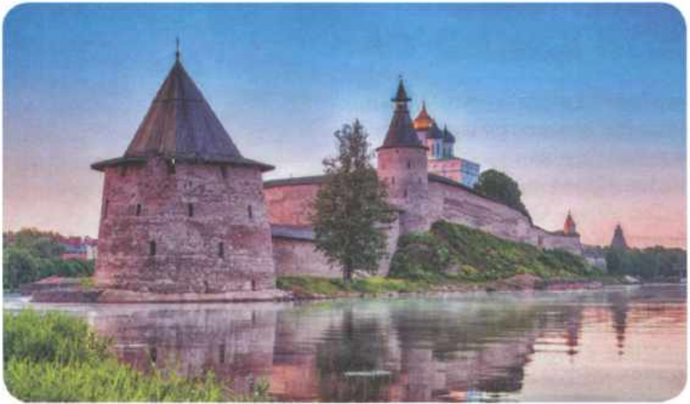
| Псковские укрепления.

к псковичам на княжение в 1342 году своего сына Вигунда. Именно там язычник Вигунд принял крещение по православному обряду и получил имя Андрей.