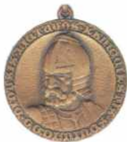
Памятная медаль, посвящённая Гедимину. Литва.