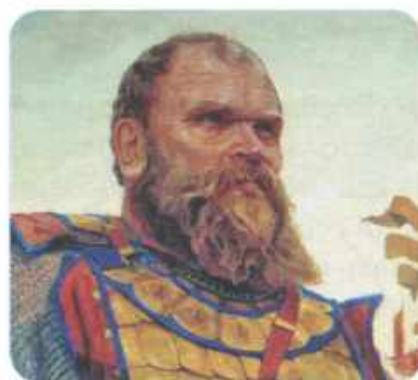
Князь Дмитрий Михайлович Боброк-Волынский.