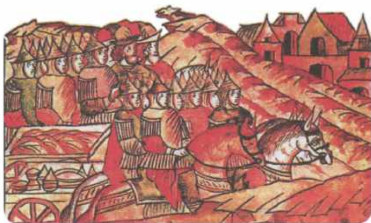
Андрей Полоцкий и Дмитрий Боброк- Волынский во главе своих дружин.

Полк правой руки составляли наиболее опытные и боеспособные литовско-русские рати. Сильной стороной дружин Андрея Полоцкого было и наличие мощной кованой конной рати.