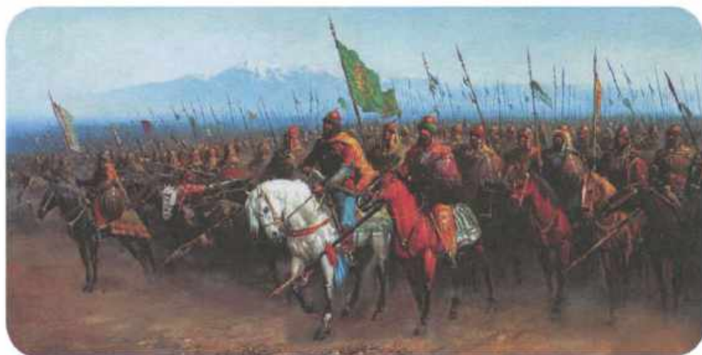
| Войско Тамерлана перед сражением с Тохтамышем.

Вспомнили и об Андрее Полоцком. Пользовавшийся авторитетом как в ВКЛ, так и в Московской Руси, 79-летний князь,