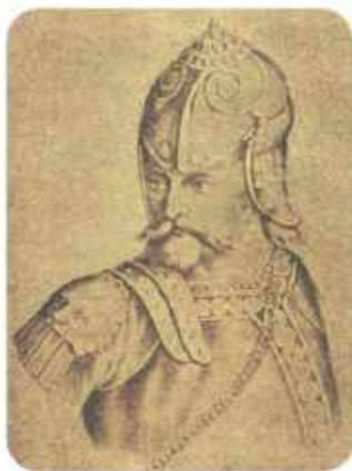
Гедимин. Рисунок К. Ляхновича. 1911 г.

Великое Княжество Литовское после смерти великого князя Гедимина было разделено на 8 уделов — между