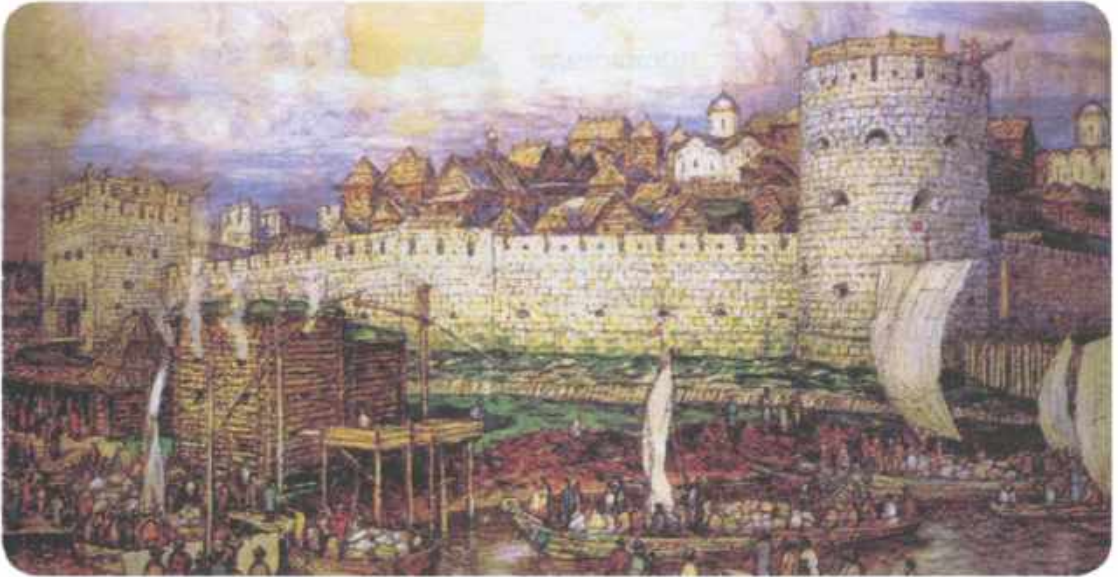
Белокаменный Московский Кремль. Художник А. Васнецов.

заперся в Кремле, надеясь на мощь только что построенных белокаменных стен, и не ошибся — Москва выстояла. Ольгерд и Андрей простояли под Москвой всего три дня — снять осаду их заставили известия из Литвы — воспользовавшись отсутствием великого князя, рубежи ВКЛ атаковали крестоносцы.