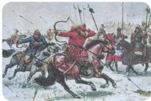
| Татарская конница.

Победа была полной. В состав Великого Княжества Литовского, Русского и Жемойтского вошли Киев с окрестностями, а также Дикие поля — Подолье и Северное Причерноморье. Великое Княжество Литовское стало наряду с Московским и Владимирским княжествами главным претендентом на объединение всех исторических русских земель. Местное население впервые более чем за век почувствовало, что есть сила, способная защитить их от произвола татар и кочевников.