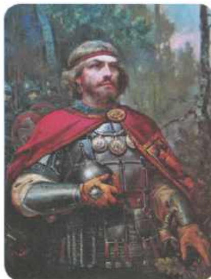
Князь Владимир Храбрый. Художник А. Шишкин.

Взвесив все за и против, Кейстут понял, что совершил в своё время серьёзную ошибку, сделав ставку на Ягайло, а не на Андрея, и в конце 1381 года пошёл походом на тевтонцев, но неожиданно повернул и обложил Вильну. Опытный Кейстут пользовался большим авторитетом среди виленчан, поэтому не встретил сопротивления и без труда овладел городом. Ягайло был пленён на пути в Вильну и привезён к Кейстуту. В столицу Великого Княжества Литовского прибыл и сын Кейстута Витовт.