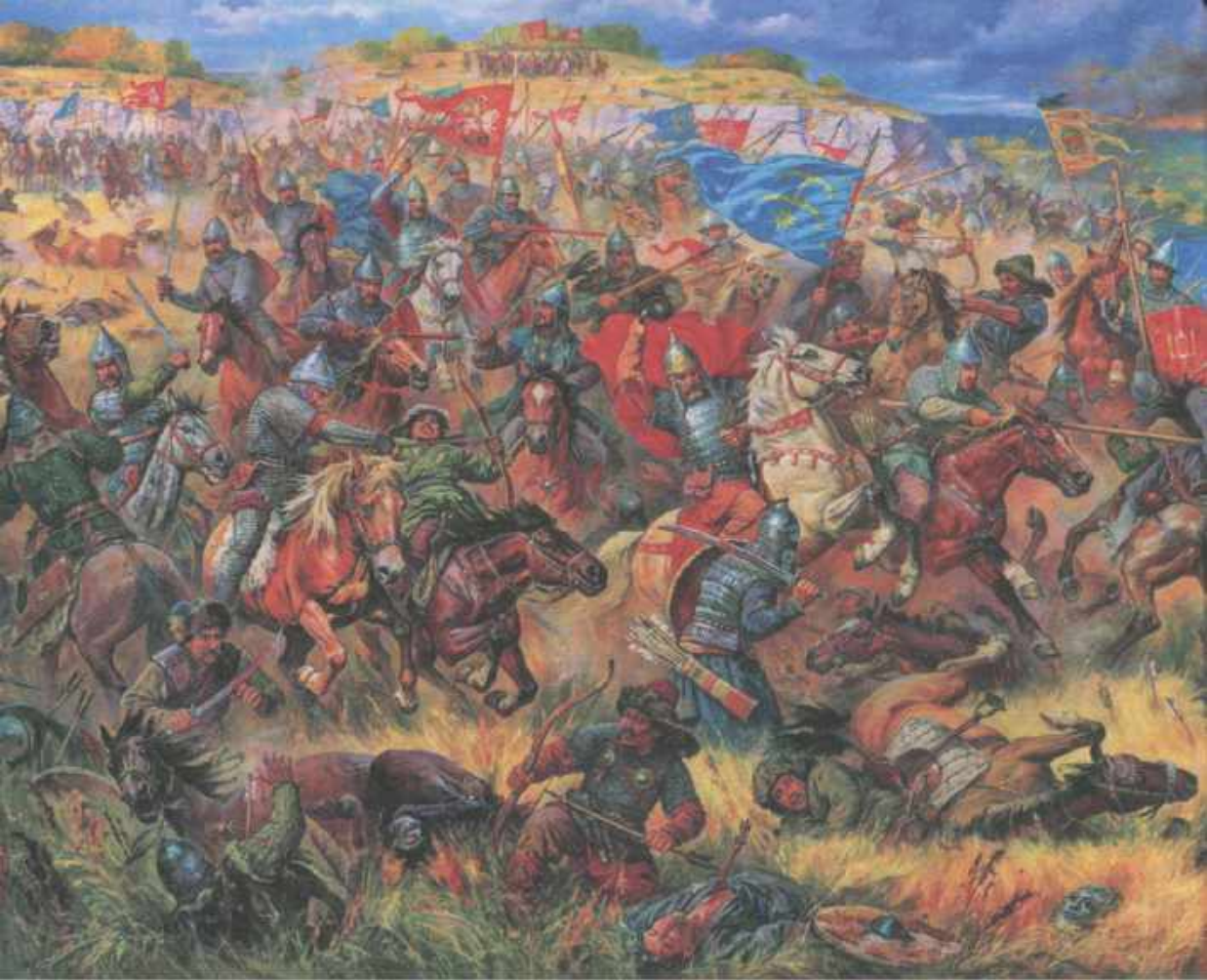
| Битва на Синих Водах. С картины А. Орленова.

Победа была полной. В состав Великого Княжества Литовского, Русского и Жемойтского вошли Киев с окрестностями, а также Дикие поля — Подолье и Северное Причерноморье. Великое Княжество Литовское стало наряду с Московским и Владимирским княжествами главным претендентом на объединение всех исторических русских земель. Местное население впервые более чем за век почувствовало, что есть сила, способная защитить их от произвола татар и кочевников.