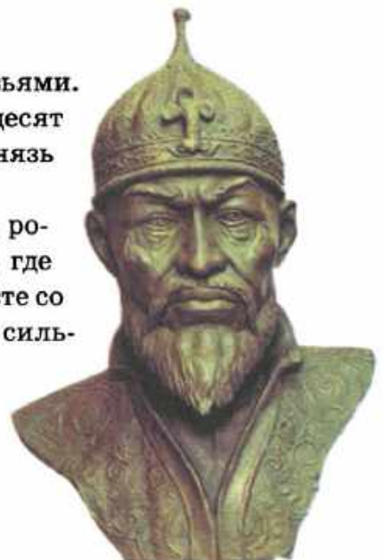
Тамерлан (Тимур). Реконструкция М. Герасимова.

Андрей Полоцкий чувствовал себя на родине неудобно и уехал на время в Псков, где его хорошо знали и где в 1394 году он вместе со своим сыном Иваном отбил наступление сильной новгородской рати.