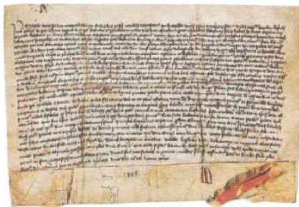
Кривская уния 1385 г.

В 1386 году Ягайло заключил династический брак с польской королевой Ядвигой и перешёл из православия в католичество, приняв имя Владислав. Согласно подписанной в Кривском замке унии