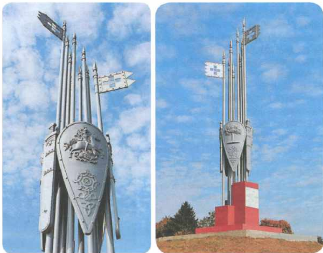
| Памятник на месте битвы на реке Воже.

законный наследник престола Золотой Орды, предпринял решительные шаги по восстановлению ордынского единства. Война в Золотой Орде между Тохтамышем и Мамаем приняла затяжной характер.