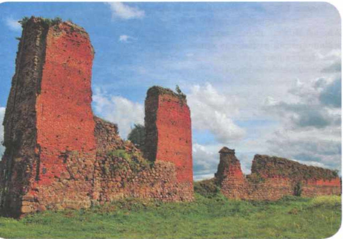
Руины башни Кревского замка.

несколькими литовско-русскими князьями. Андрею Полоцкому было уже за семьдесят и Ягайло решил уступить — старый князь был уже не так для него опасен.