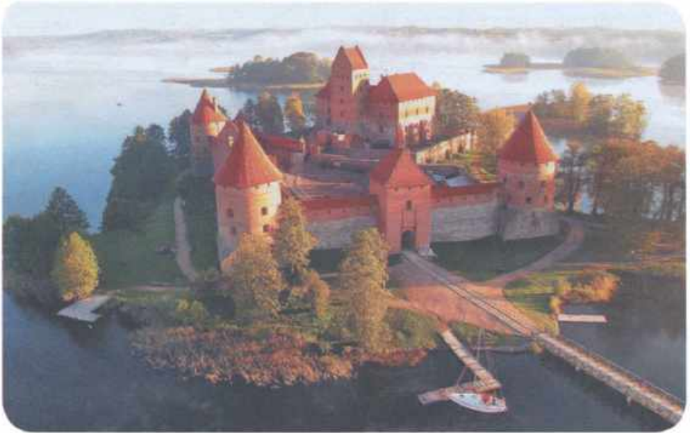
Трокский замок. Современный вид.

Андрей Ольгердович с дружиной находился в Полоцке и внимательно следил за развитием событий. Но достаточных сил вмешаться в борьбу с Ягайло у него не было. К тому же грозные события случились в 1382 году и в Великом княжестве Московском, на чью помощь и поддержку опирался полоцкий князь. Хан Тохтамыш, собрав большую армию, неожиданно вторгся в русские пределы.