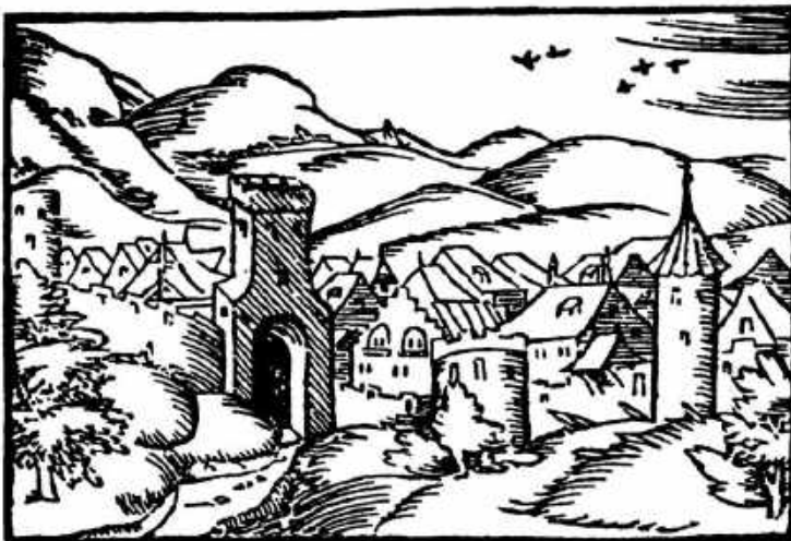
| Вильна. С гравюры 1550-х гг.

В 1345 году Кейстут передал виленские земли Ольгерду. Ольгерд был провозглашён великим князем литовским, русским и жемойтским, а Кейстут стал его фактическим соправителем. Кейстут сосредоточился на борьбе с крестоносцами и защите