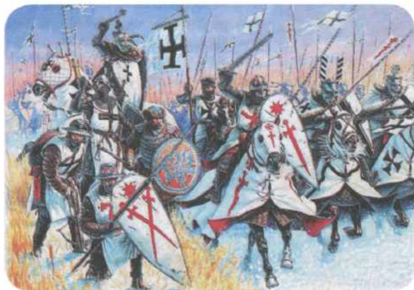
Рыцари Тевтонского ордена.

Вероятно, Ольгерд, понимая, что Кремль взять очень сложно, и не желая ослабления своей армии, удовлетворился отдельными уступками со стороны Москвы и предложил мир. Для того чтобы выйти из непростой ситуации, Дмитрий Донской и Ольгерд породнились, заключив династический брак между двоюродным братом Дмитрия Владимиром Храбрым и дочерью Ольгерда Еленой.