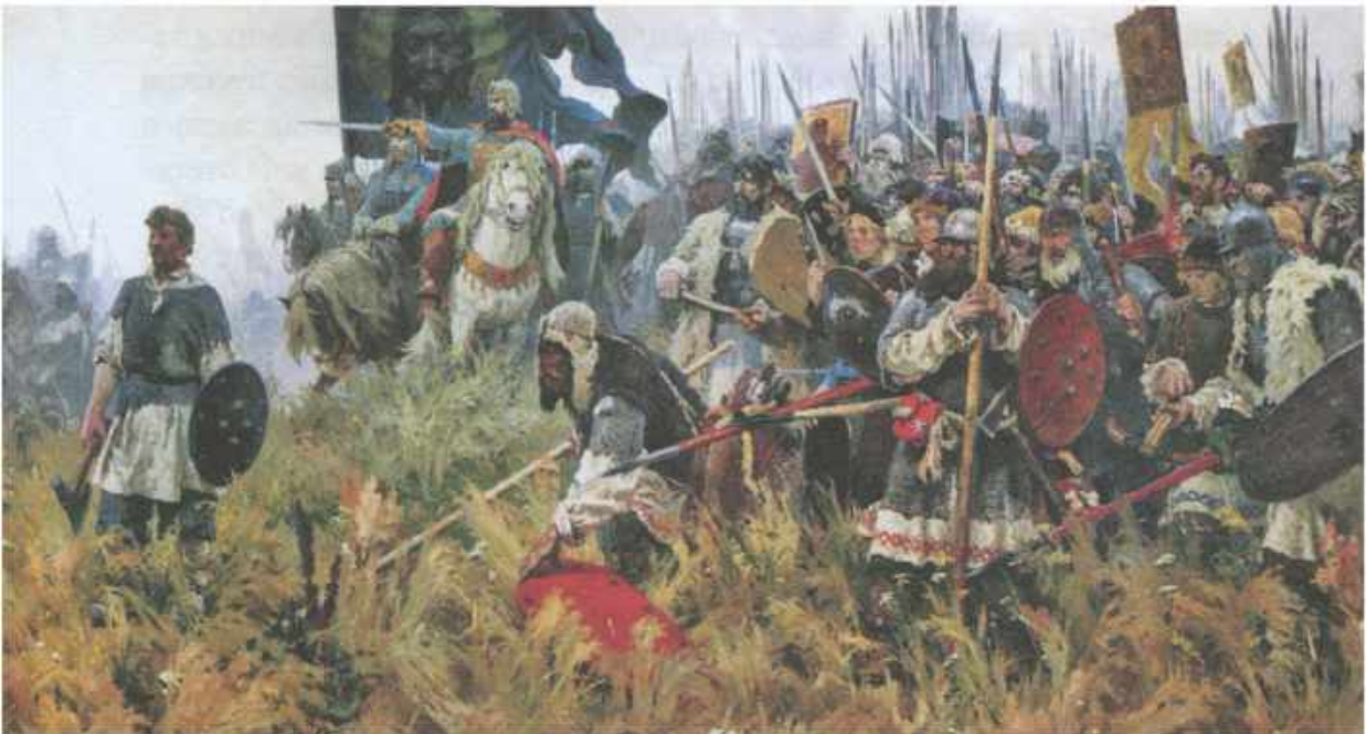
| Утро на Куликовом поле. Художник А. Бубнов.

Наконец Владимир Храбрый дал сигнал прекратить преследование и назначил сбор войск. Среди тел погибших нашли и Дмитрия Донского, который был без сознания.