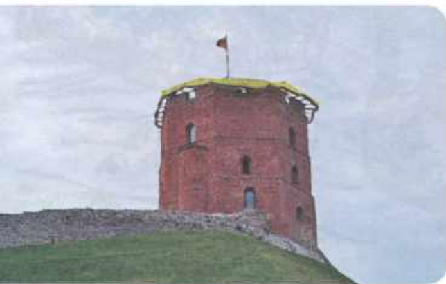
Башня Гедимина в Вильнюсе.