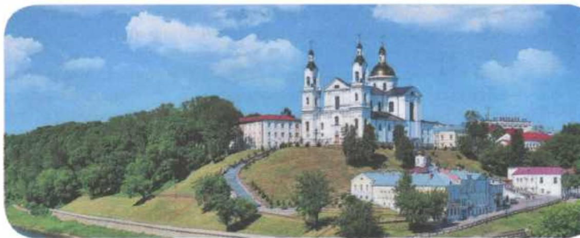
| Витебское замчище. Современный вид.