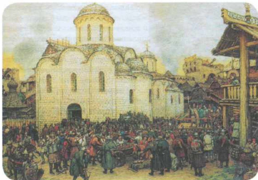
Оборона Москвы от Тохтамыша. Художник А. Васнецов.

отказавшись от зависимости от крестоносцев. Ягайло и Витовт выиграли у тевтонцев несколько сражений. В итоге Ягайло сумел разрушить союз Витовта и крестоносцев, не позволил возникнуть союзу Андрея Полоцкого и Витовта, а также обеспечил нейтралитет в литовских делах со стороны Дмитрия Донского.