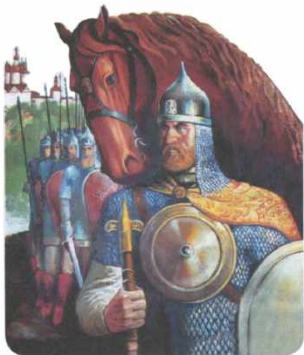
| Дмитрий Ольгердович.

Вот что говорится об этом в памятнике древнерусской литературы конца 14 — начала 15 века «Задонщина» (полное название — «Слово